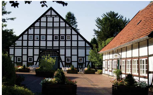
Bückeburg (Landfrauenschule) Jetenburger Straße