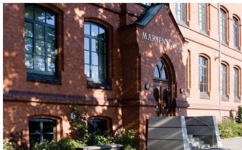
Bückeburg (Marienschule) Am Oberstenhof