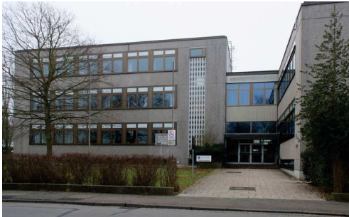
Rinteln (Kreishandelslehranstalt) Dauestraße