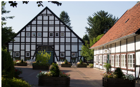
Bückeburg (Landfrauenschule) Jetenburger Straße