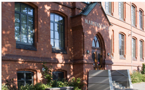
Bückeburg (Marienschule) Am Oberstenhof